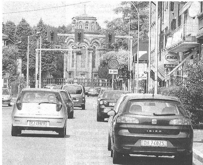
L'incrocio trafficato attende un rondò per garantire maggiore sicurezza

Lavori pubblici (ecologia, verde pubblico, manutenzioni, opere)