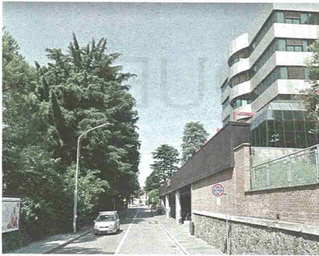
Tanti nodi viabilistici riguardano la zona di via Bettinelli