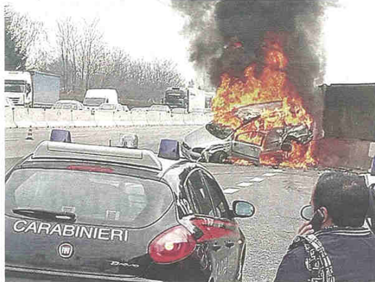
FUOCO I carabinieri sul luogo dell'incendio in A8

I carabinieri estraggono due persone dall'abitacolo