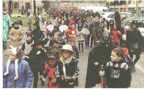
V.D. La sfilata di Carnevale che si è tenuta ieri a Castellanza

ieri tante mascherine si sono divertite sfilando in piazza e poi tutti all'oratorio con lo spettacolo di magia e merenda per tutti i bimbi. Infine a Fagnano Olona la sfilata è stata un vero e proprio trionfo di colori e allegria: un bruco gigante, farfalle, coccinelle e un mazzo di carte di cuori. Insomma Fagnano come il Paese delle Meraviglie di Alice, ha fatto capolino persino uno Stregatto. Qualcuno ha persino preso in giro, come vuole lo spirito del Carnevale, la nuova moda di mangiare gli insetti trasformandosi in un raffinato e improbabile chef stellato.