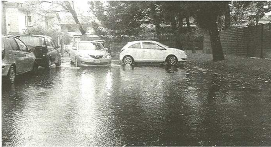
Il parcheggio delle Poste di Solbiate Olona sommerso dall'acqua e dalle polemiche

Già il mese scorso in molti avevano segnalato il problema degli allagamenti nel parcheggio: oltre dieci centimetri di acqua che formano una vera e propria piscina. Impossibile parcheggiare e scendere dall'auto, seppure lo spazio sia limitato. Molti utenti si sono lamentati anche con il direttore di sede che è impotente rispetto a questo disservizio. E anche ieri mattina la scena che si è presentata all'utenza è stata la medesima, se non peggiorata. Ieri alcune auto sono rima-